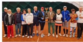
Hámori Tamás Emlékverseny - Grand Slam Park