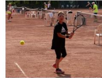
Haga Gizi Emlékverseny - Építők