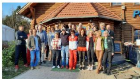
ILTC Magyarország - Luxemburg találkozó