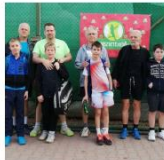
Családi Páros Verseny - Pillangó TK