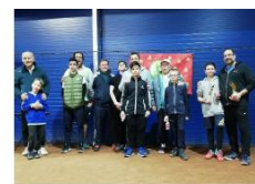
Családi Páros Verseny - BVSC