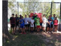
Családi Páros Verseny - Balatonszárszó