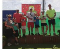
Családi Páros Verseny - Gubacsi TK